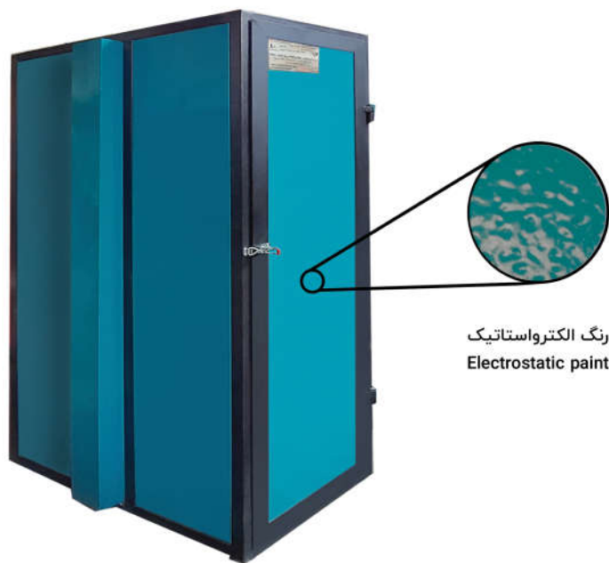
رنگ الکترواستاتیک Electrostatic paint

Royeshgar dryer can be used to dry a variety of vegetables and fruits, this dryer required a temperature for drying which is entered into the system by a gas blower in a short period of time. This machine is more advance compared to the conventional system and brings you suitable products in which the humidity of the product stays at the lowest amount.