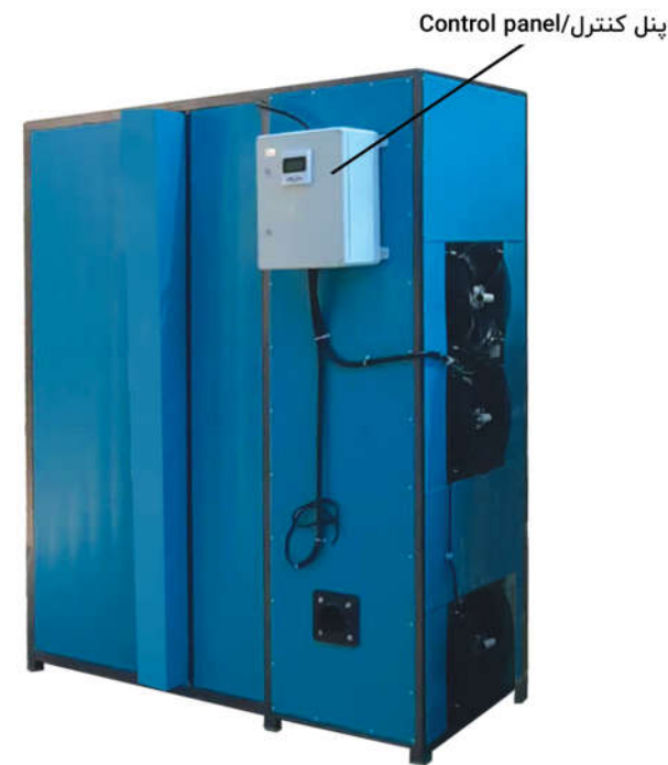
پنل کنترل/Control panel